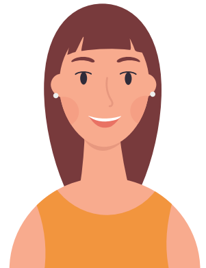
Mensch mit Assistenzbedarf